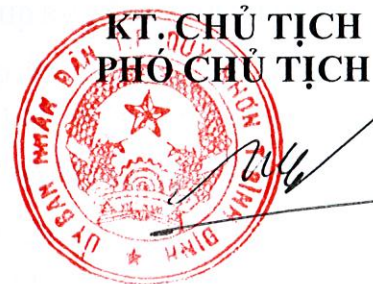
Nguyễn Công Vịnh