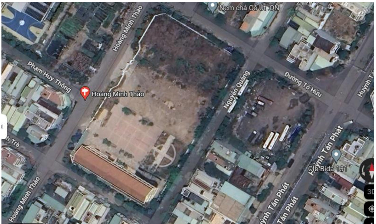
Mặt bằng hiện trạng Trường THCS Đống Đa (cơ sở 2)