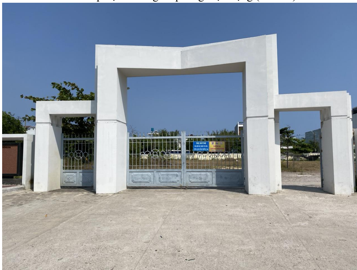
Cổng chính (cơ sở 2)