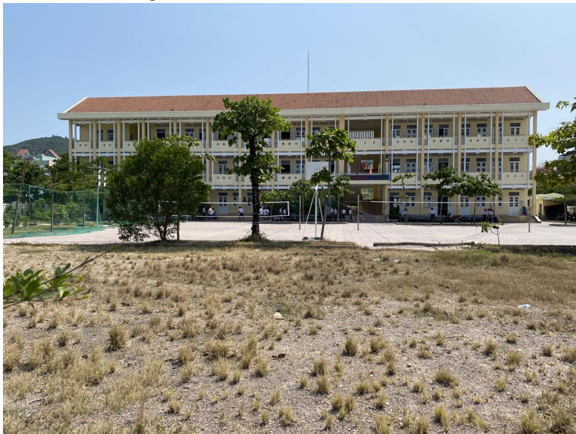
Nhà lớp học 03 tầng 15 phòng hiện trạng (cơ sở 2)